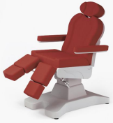
No:9 Bordo / Claret Red