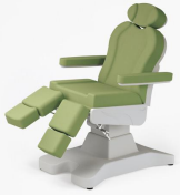
No:5 Fıstık Yeşili / Pistachio Green