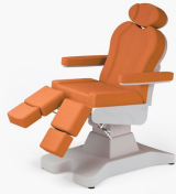
No:8 Turuncu / Orange