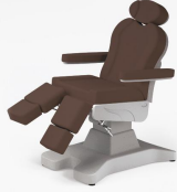
No:4 Koyu Kahve / Dark Brown