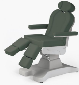
No:15 Koyu Yeşil / Dark Green