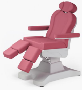
No:10 Pembe / Pink