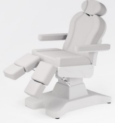
No:1 Beyaz / White