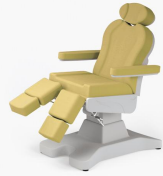
No:7 Sarı / Yellow