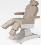
No:2 Krem / Beige