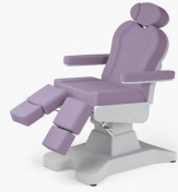
No:11 Lila / Lilac