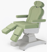
No:6 Açık Yeşil / Light Green