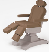
No:3 Sötük Kahve / Milky Brown