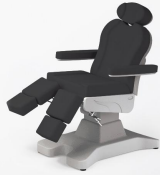
No:16 Siyah / Black