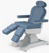
No:12 Açık Mavi / Light Blue