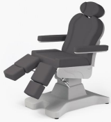
No:14 Gri / Gray