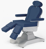
No:13 Lacivert / Navy Blue